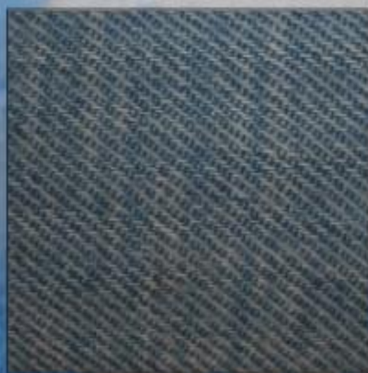
amostra não tratada